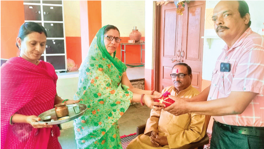
हरिभूमि न्यूज | नलखेड़ा

नई शिक्षा नीति के अंतर्गत आगामी सत्र में शिक्षण के साथ अन्य गतिविधियों को करवाना अनिवार्य होगा। समर कैंप जैसा वर्ग प्रत्येक विद्यालय में आयोजित करना होगा। नई शिक्षा नीति में शिक्षण के साथ साथ अन्य गतिविधियों पर भी ध्यान देना होगा। उक्त विचार स्थानीय सरस्वती शिशु विद्या मंदिर माधवकुंड में ग्रीष्मकालीन गतिविधियों के अंतर्गत चल रहे समर कैंप के छठवें दिन गुरुवार को मुख्य अतिथि के रूप में उपस्थित