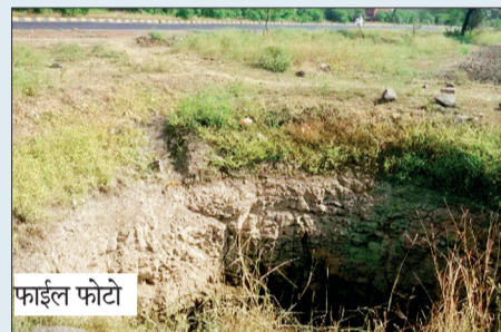
फाईल फोटो अन्य धाराओं के तहत एफआईआर दर्ज की गई है।